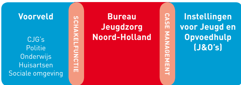
Figuur 2: Samenwerking in de zorgketen - één gezin, één plan

Hiervoor heeft Bureau Jeugdzorg regelmatig contact met de Instellingen voor Jeugd en Opvoedhulp in Noord-Holland. Dat zijn bijvoorbeeld tehuizen en plekken waar intensieve dagbehandeling plaatsvindt.